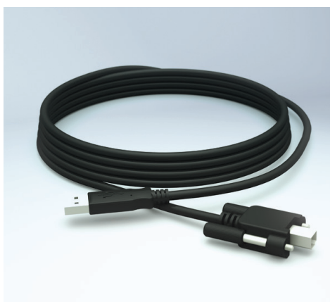
Cable USB seguro