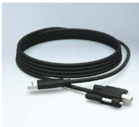
[图像] 安全 USB 连接线